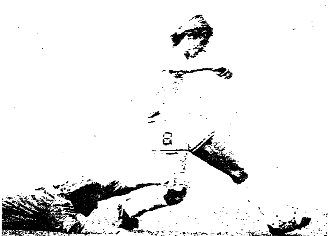
كاتنجيا يمر على الحارس تافاريل ويسجل هدف الارجنتين